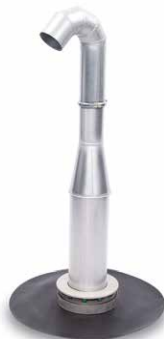
KRASO® Schwanenhals - wärmegeklämmt -