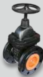
Keilflachschieber für KRASO® Pumpensumpf Typ Q - Fäkalien -