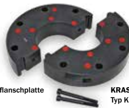
KRASO® Kunststoffflanschplatte Typ KFP - geteilt -