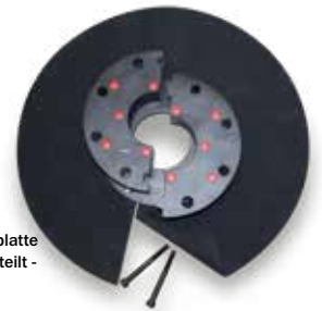
KRASO® Kunststoffflanschplatte Typ KFP - Folienflansch - geteilt -