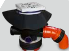
KRASO® Kellerablauf mit Folienflansch