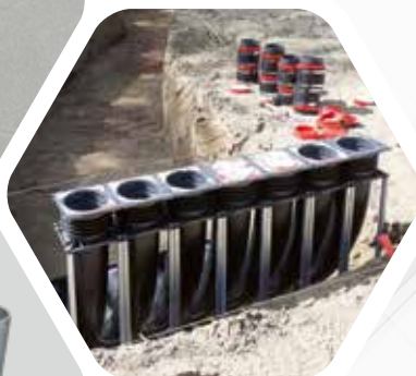
KRASO® Gebäudeeinführung KDS 150 mit KRASO® Spachtelflansch erhältlich Aufgerauter Kunststoff-Spachtelflansch zur Einbindung in Bodenbeschichtung bzw. Abdichtungsbahnen

KRASO® Gebäudeeinführung KDS 150 Hier geht es zum Montagevideo (Einfach QR-Code scannen!)