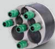
KRASO® Dichteinsatz Universal Mehrfach - geteilt - 100 Ausführung 2