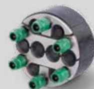
KRASO® Dichteinsatz Universal Mehrfach - geteilt - 100 Ausführung 3