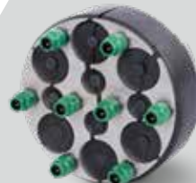
KRASO® Dichteinsatz Universal Mehrfach - geteilt - 150 Ausführung 2