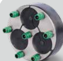
KRASO® Dichteinsatz Universal Mehrfach - geteilt - 150 Ausführung 1