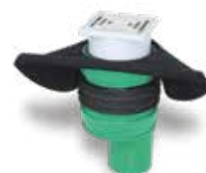
KRASO® Bodenablauf Typ FS - RS mit Folienflansch FrostSicher - RückstauSicher -