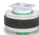
KRASO® Bodenablauf - wärmegeklämt -